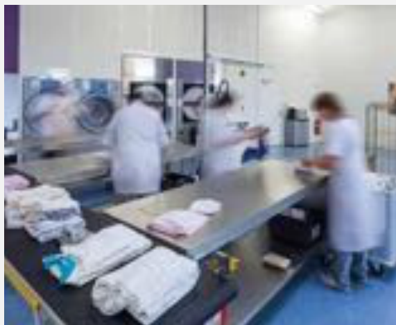
ESAT à Allaines

En 1999, Electrolux crée le club Rével'Action, groupe de réflexion et de travail pour anticiper l'avenir de l'activité blanchisserie. Dans le cadre du projet personnel individualisé des travailleurs handicapés, le Club développe par exemple en 2002 le premier logiciel métier : LEA (Logiciel d'Evaluation professionnelle en blanchisserie Adaptée).